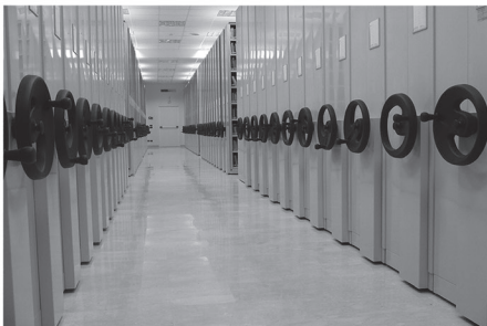
Biblioteca Pontificia Università Gregoriana - Roma