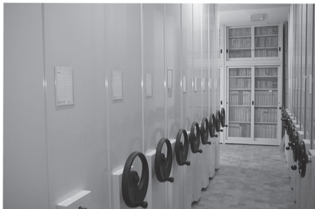
Biblioteca Provinciale PP. Cappuccini SS. Redentore - Venezia