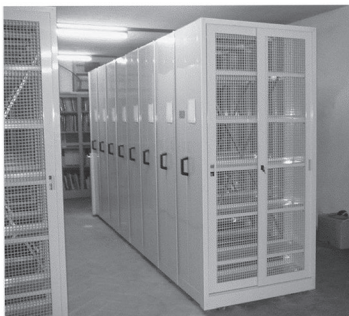
Basilica Santa Croce - Firenze